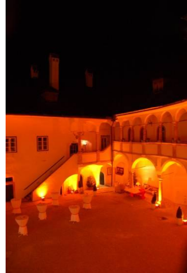
Schloss Ort in Orange und Empfang im Schlosshof