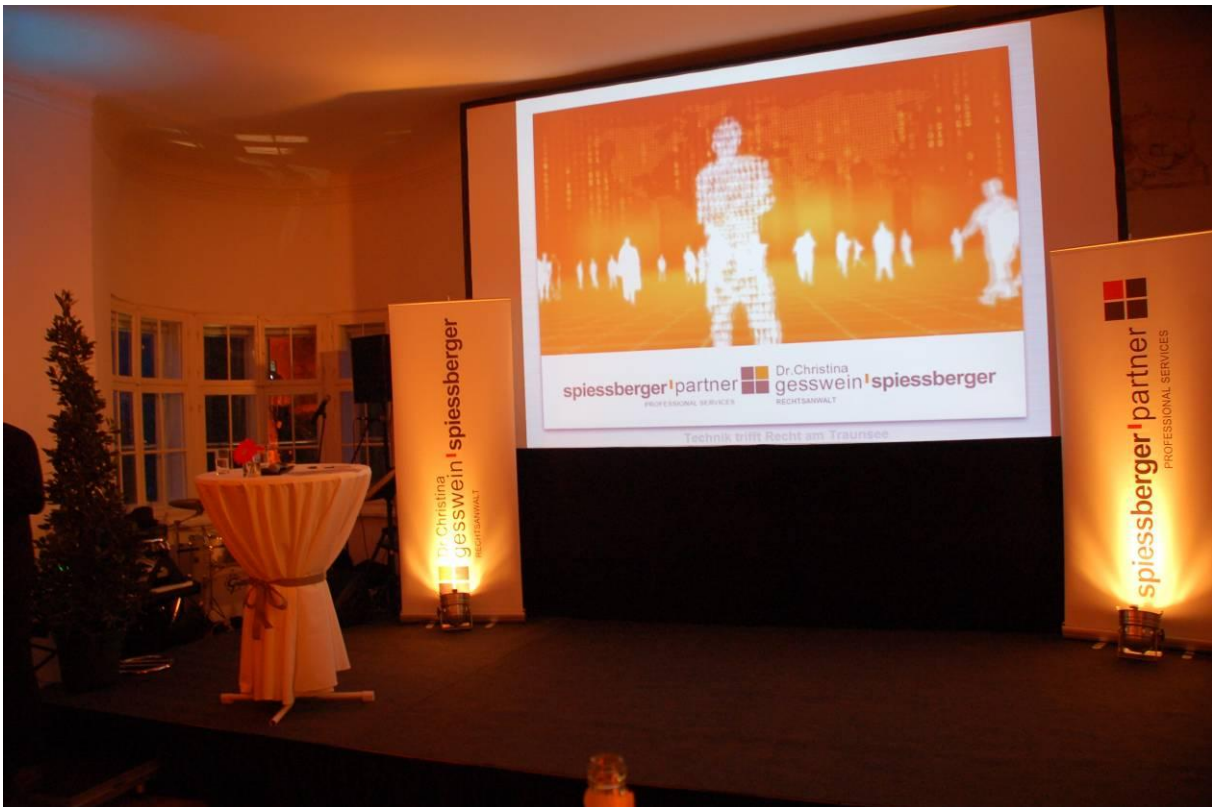
Internet Trends präsentiert in Gmunden